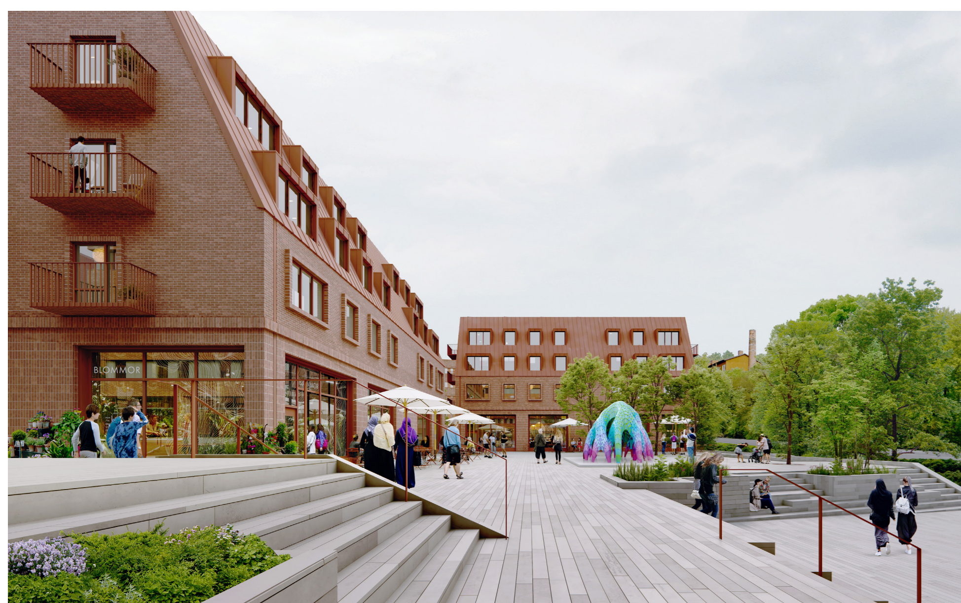
Illustration som visar en möjlig utformning av det föreslagna torget. Bild: Utopia arkitekter