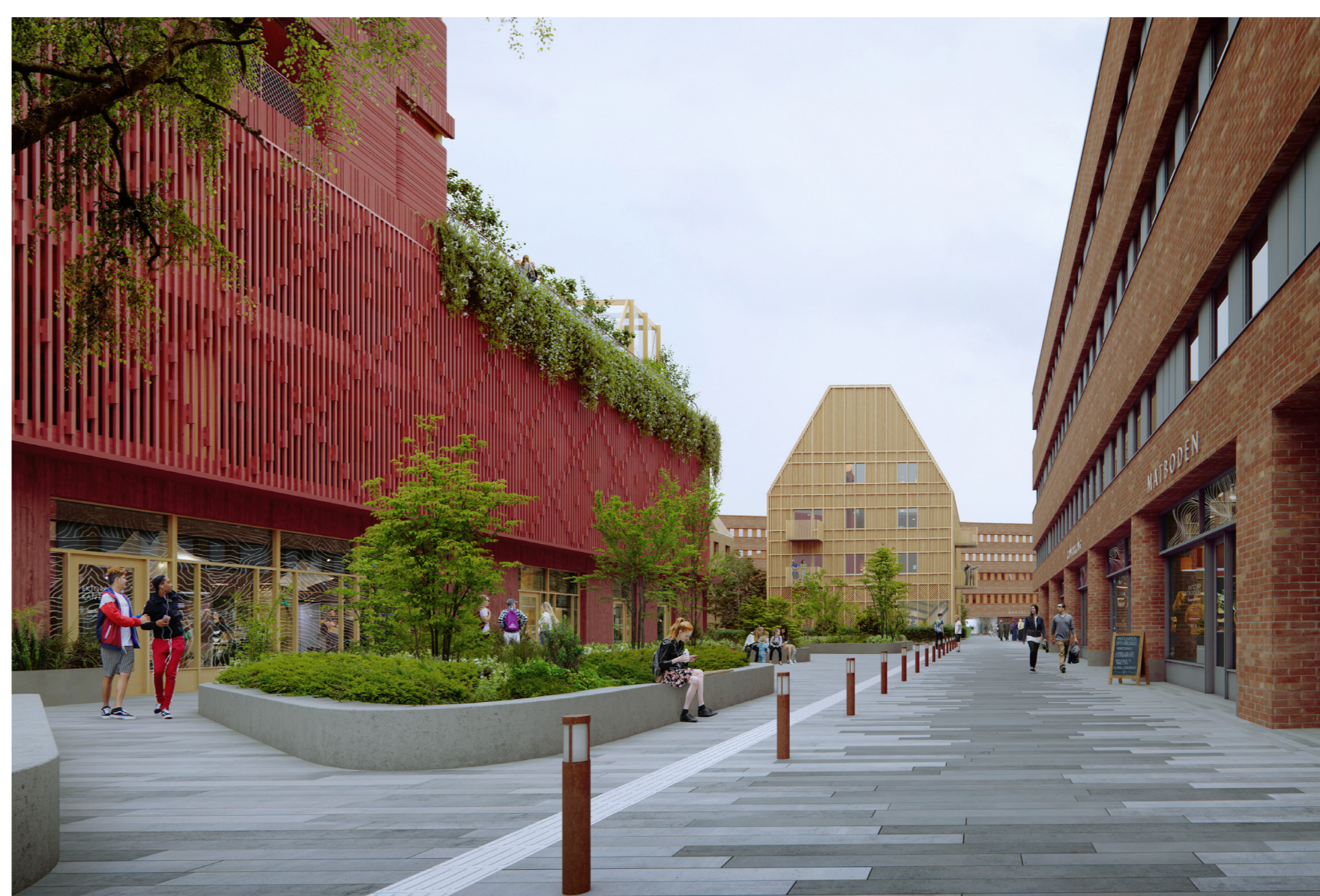
Illustration som visar möjlig utformning och karaktär i framtidens Ektorp centrum. Till vänster i bild syns parkeringshuset och till höger i bild syns den befintliga tegelbyggnaden i centrumets sydvästra hörn. Mitt i bild illustreras hur ett av husens två trähuskvarter kan utformas. Bild: Utopia arkitekter

Öster om centrum möjliggörs ett bostadskvarter som också rymmer förskola och parkeringsgarage. Kvarteret ersätter dagens parkeringsgarage som rivs. Kvarteret Ektorpshöjden består fem bostadsvolymer med framträdande siluett, markerad bottenvåning och låg takfot.