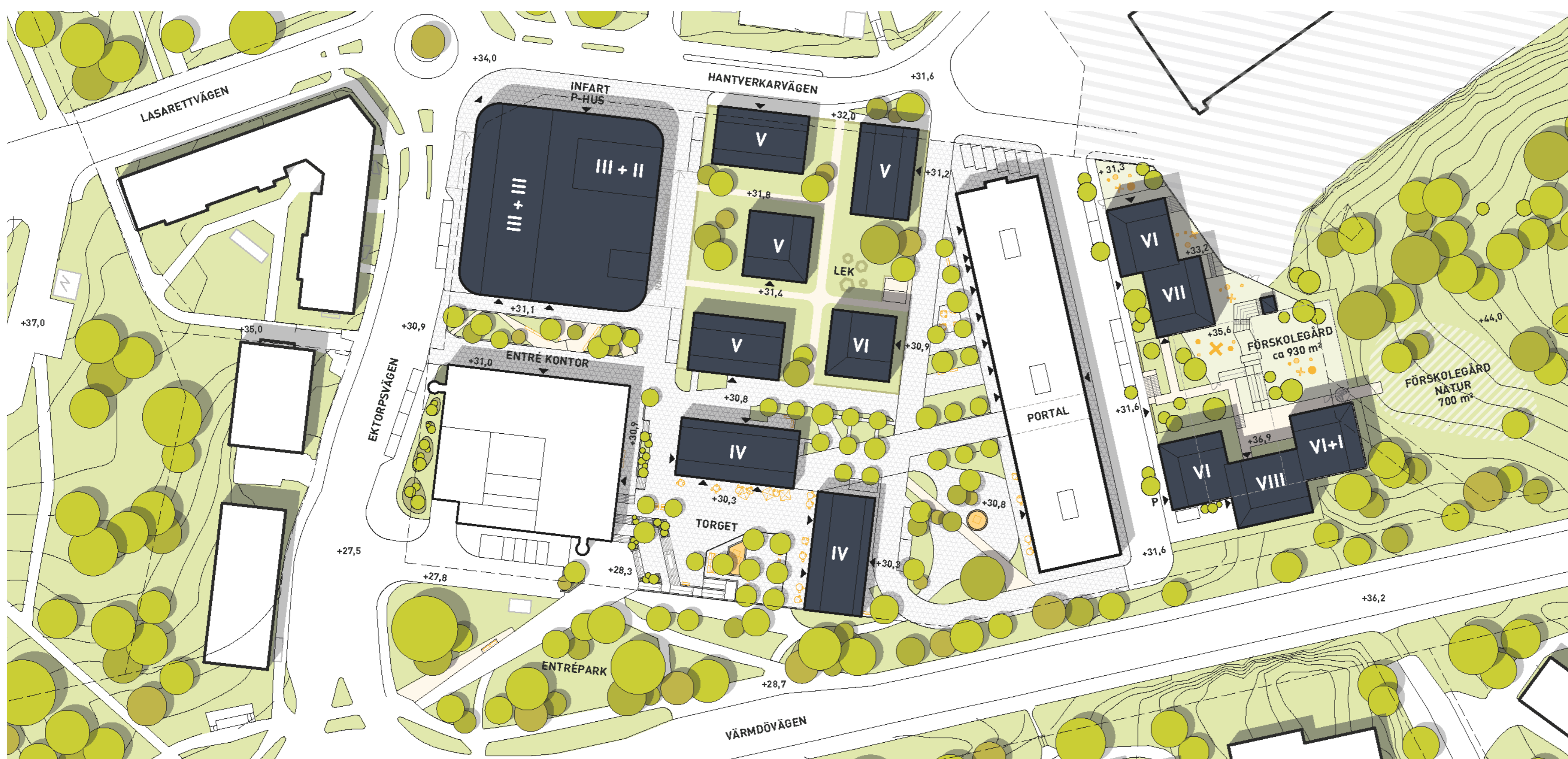
Situationsplan som redovisar ny bebyggelse i blått och befintlig bebyggelse i vitt. Bild: Utopia arkitekter